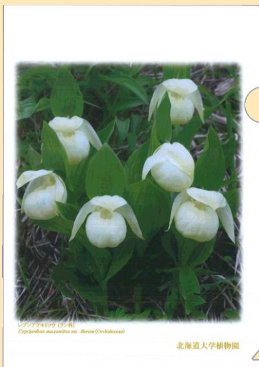
レブンアツモリソウ No.1