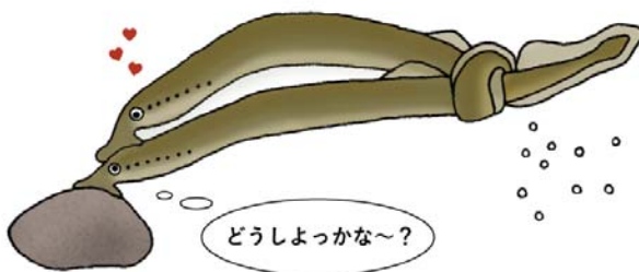
図1. ヤツメウナギの生態