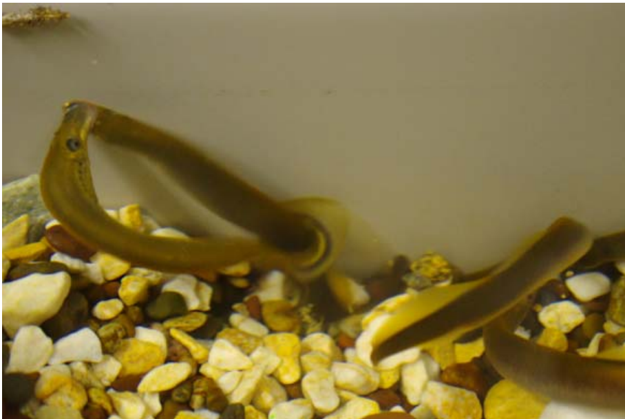
図2. ヤツメウナギの産卵行動。ヤツメウナギは河床の石を取り除いて作った窪地（産卵床）に多数の雌雄が集まって産卵する（上図：森田健太郎氏撮影）。雌雄とも複数のパートナーと交配を行う典型的な乱婚だが、1回の交配は通常1対1のペアで行う（下図：山崎千登勢氏撮影）。まず、吸盤のような口でメスが石などの基質に吸い付く。次にオスがメスの頭部に吸い付き、体をメスの総排泄腔あたりに巻き付ける。最後に、メスが体を激しく震わせることによって産卵を行う。多い時には1匹のメスが100回以上の交配を繰り返す。