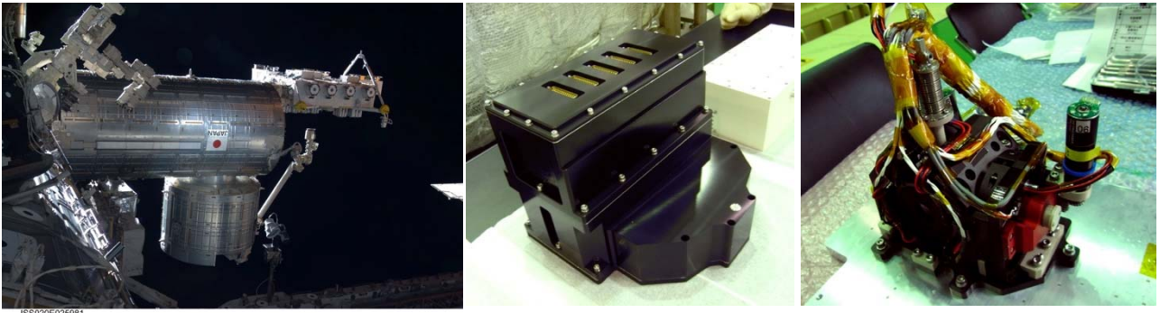
図 1 (写真左) 国際宇宙ステーション・「きぼう」日本実験棟。この与圧部において、2013年11月から翌年6月まで、実験が行われた。(写真中央) 本実験のために新たに開発された宇宙実験装置。愛称「Ice Crystal Cell 2」。本装置は、JAXA 種子島宇宙センターから、2013年8月に「こうのとりの4号」に搭載して打ち上げられた。(写真右) Ice Crystal Cell 2の心臓部分である氷結晶成長装置。低温科学研究所技術部により、設計・開発が行われた。