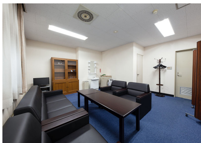
入り口奥より撮影