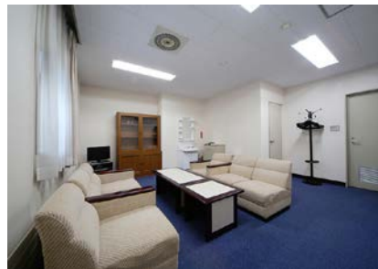
入り口奥より撮影