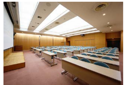
ステージ側面より撮影