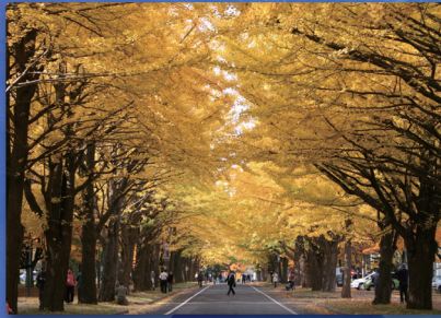
北海道大学イチョウ並木