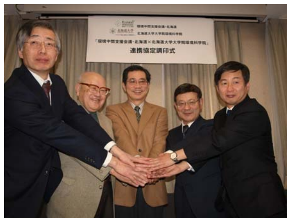
北海道大学環境科学院で行われた調印式の様子