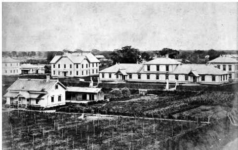
札幌農学校全景(1879年)

展示に垣間見られる北大生の青春と、みなさんの現在・過去・未来の学生生活・青春時代を重ね合わせていただければと思います。