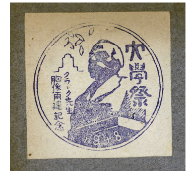
《大学祭記念スタンプ》