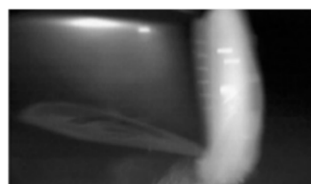
ゴルフクラブで打っても壊れない高強度DNゲル (ハイスピードカメラで撮影)