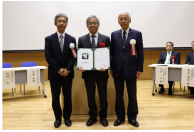
一般財団法人砂防・地すべり技術センター 様(中央) (平成31年4月16日)