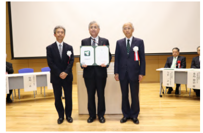
アジア航測株式会社 様 (中央) (平成31年4月16日)