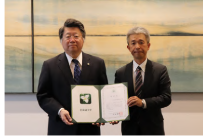
岩田地崎建設株式会社 様(平成31年4月23日)