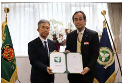
協和キリン株式会社 様 (令和元年12月17日)