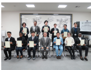
総長奨励金・私費外国人留学生特待プログラム留学生採用証書授与式を挙