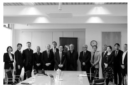
異分野融合研究に係る会議