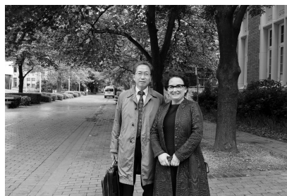
両大学の理学研究院長