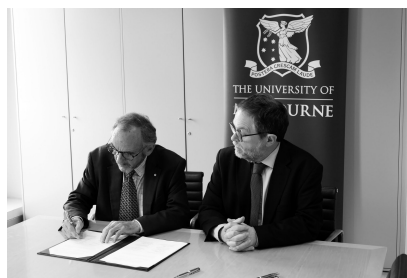
マクラスキー理事とゾベル副理事