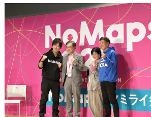
寶金総長がNoMaps2022北大えぞ財団入団記念セッションに登壇