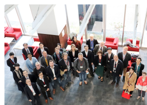
MIRAI2.0 Research & Innovation Week 2022に出席