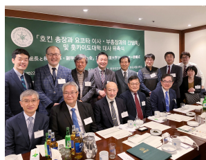
韓国アンバサダー・パートナー会の会合に寶金総長及び横田理事・副学長が参加