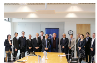
寶金総長一行が豪メルボルン大学を訪問