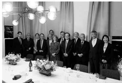
マスケル学長夫妻と寶金総長一行