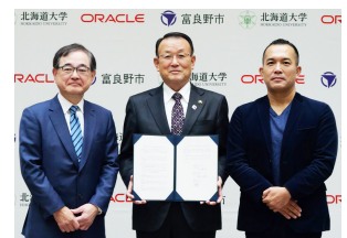
北海道大学、富良野市と日本オラクルがスマートシティ推進に関する産官学連携協定を締結