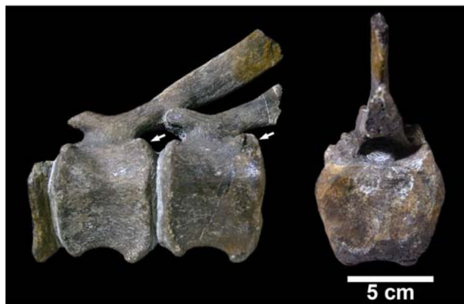
図 3 : 尾椎の一部と後方からみた関節面（写真右）

保存された椎体は、断面の形が六角形であり、前後の関節面は平らな形状です（図 3）。これらの特徴から、ハドロサウルス科恐竜（鳥盤目 鳥脚亜目）のものと考えられます。ハドロサウルス科恐竜とは、植物食恐竜で、白亜紀後期に繁栄した恐竜として有名です（図 4）。