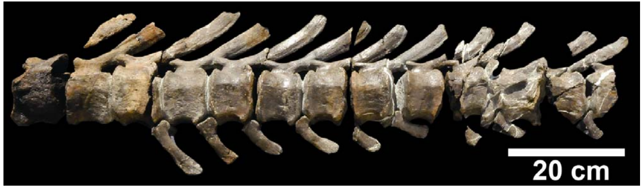
図 2 : 発見された恐竜の尾椎骨化石

保存された椎体は、断面の形が六角形であり、前後の関節面は平らな形状です（図 3）。これらの特徴から、ハドロサウルス科恐竜（鳥盤目 鳥脚亜目）のものと考えられます。ハドロサウルス科恐竜とは、植物食恐竜で、白亜紀後期に繁栄した恐竜として有名です（図 4）。