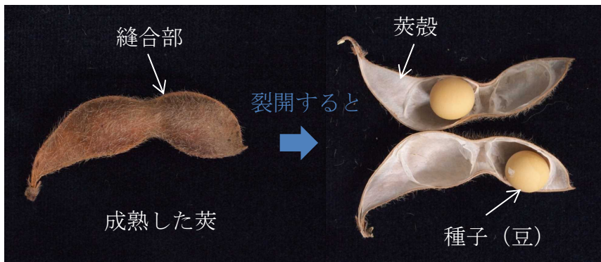
図 1. 大豆の莢の構造