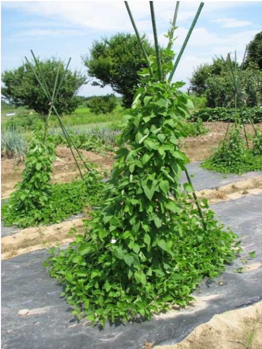
野生大豆の植物体

ツルマメとも呼ばれ、中国、朝鮮半島、日本、ロシア東部などに自生しています。栽培大豆の学名が Glycine max であるのに対し、 Glycine soja と、別種として扱われていますが、交配は可能です。栽培大豆は、3000年-5000年ほど前に、中国で野生大豆が栽培化され誕生したと考えられています。