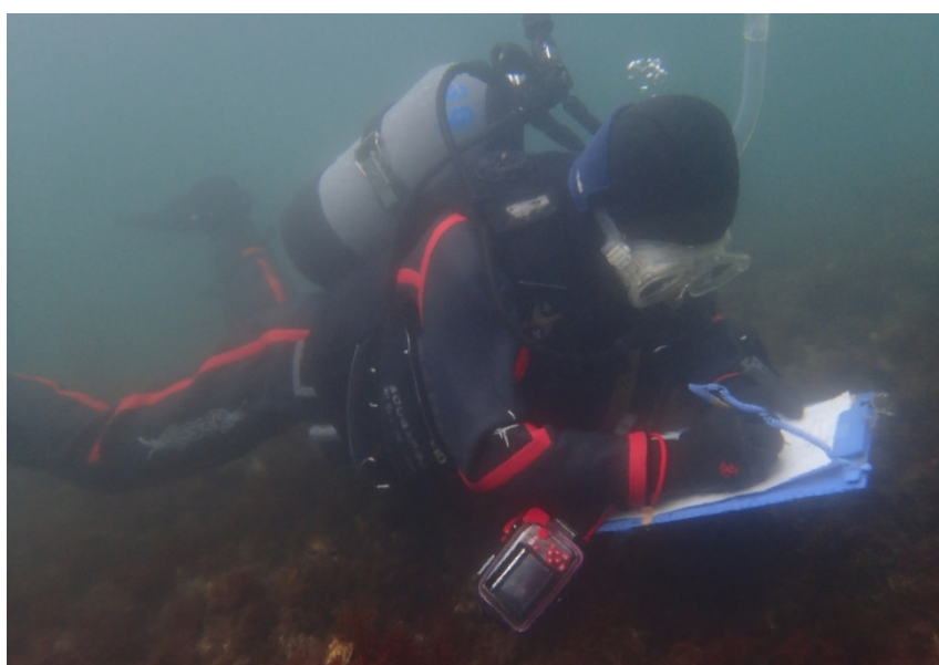
図6 潜水目視調査の様子