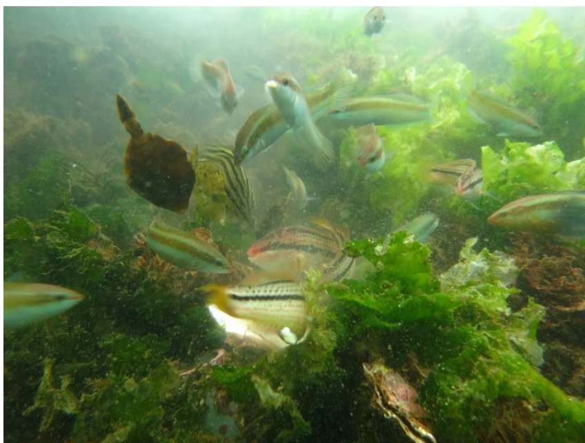
図5 目視で観察できる魚類