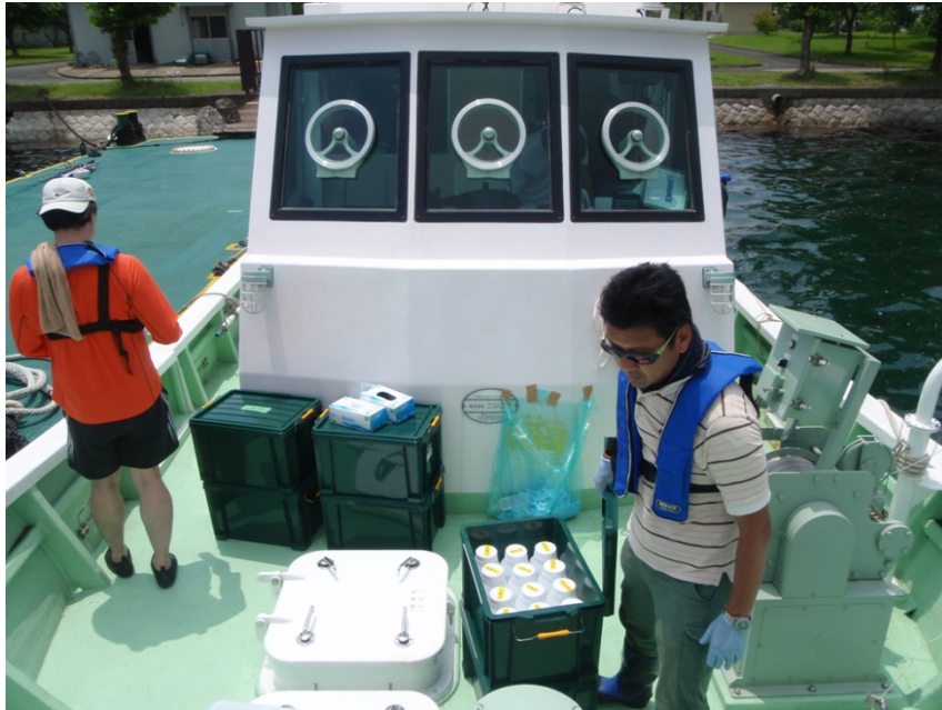
図3 採水後の船の様子