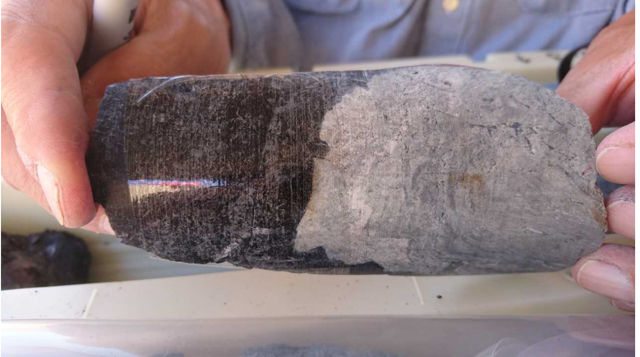
写真：オマーンオフィオライトの地殻-マントル境界付近コア試料。下部地殻を代表する斑れい岩（白）と最上部マントル試料のダナイト（かんらん岩、黒）が接している。