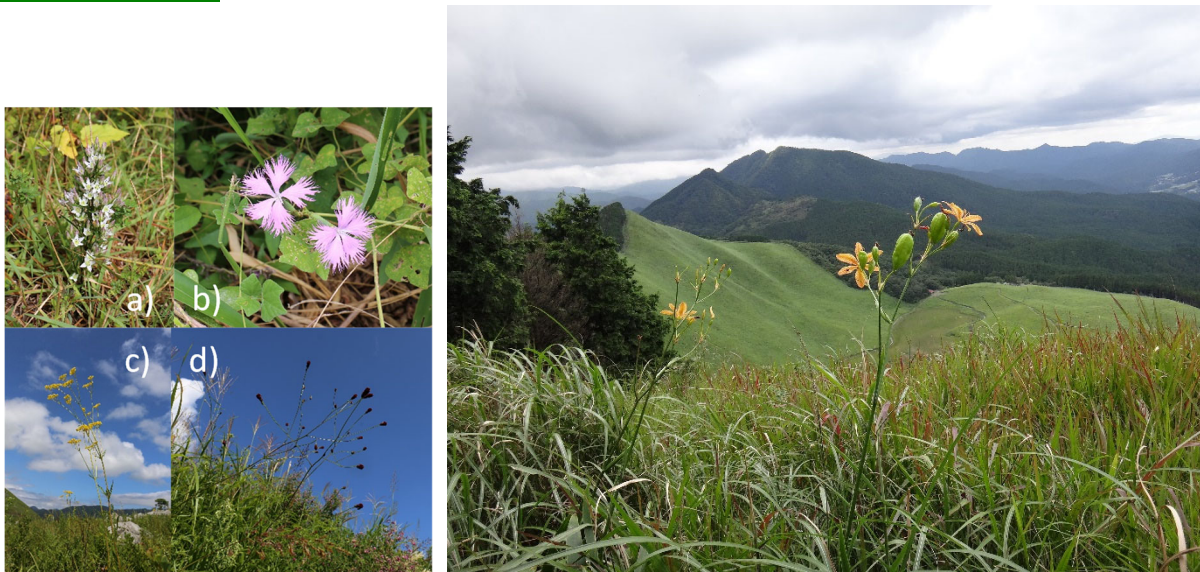
図 1. (左) 草地に特化した 4 種の対象草本植物。(a) センブリ、(b) カワラナデシコ、(c) オミナエシ、(d) ワレモコウ。(右) 野焼きによって維持されている代表的な草地 (奈良県・曽爾高原)。