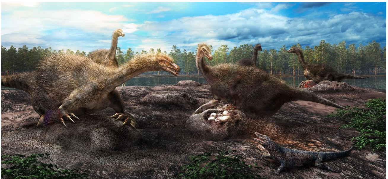
図3. テリジノサウルス類恐竜の集団営巣の復元図。復元画提供：服部雅人氏。