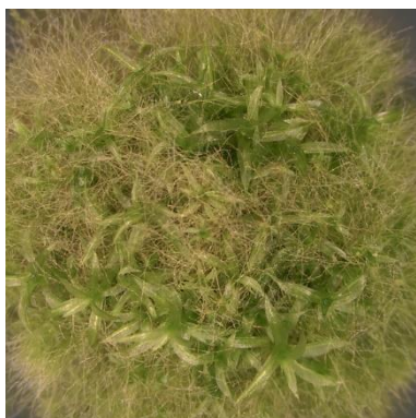
図1 ヒメツリガネゴケ

コケ植物の一種であるヒメツリガネゴケは、平面的に成長する糸状の原糸体と、立体的に成長するシュートを環境に応じて作り分けます（図1）。これまで、原糸体からシュートへと成長戦略を切り換える遺伝子が発見されるなど、植物の進化を解き明かす成果が挙げられてきました（注釈1）。それでは、シュートを作るために必要な細胞の材料はどのようにして生み出されているのでしょうか？平面的な成長から立体的な成長へと戦略を変化させたなら、それに合わせて代謝状態を調える必要があるはずです。そこで研究グループは、体内の代謝状態を成長戦略に合わせて変化させる仕組みを明らかにしようと考えました。