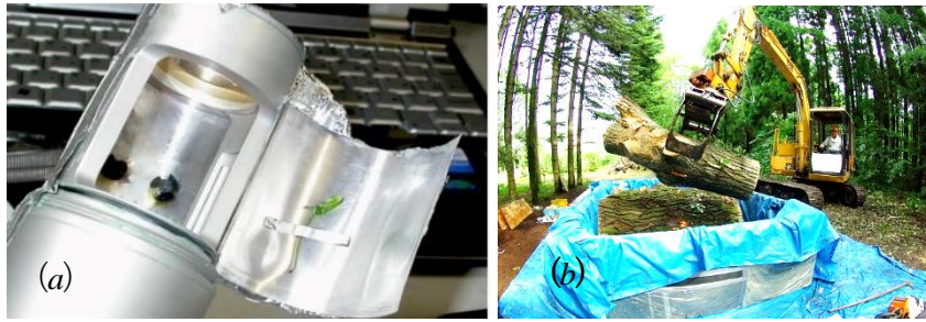
図 1. (a)木本植物の芽生えの呼吸測定の様子、(b)大木（樹高 34m）の幹を呼吸測定装置に入れる様子 大木は 8m 3 の装置で数回に分けて測定し、測定値を足し合わせて個体呼吸としました。植物のサイズに合わせて様々な大きさの装置で測定しますが、測定原理と CO 2 センサーは統一しました。

せることを意味します。さらに、木本、草本ともに、地上部は地下部より高い指数の累乗式でモデル化されました（図 2b, c）。また、草本と木本の呼吸の重なりは地上部よりも地下部でより大きいことが明らかとなりました。これは、地上環境よりも地下環境がより均一であるためでしょう。