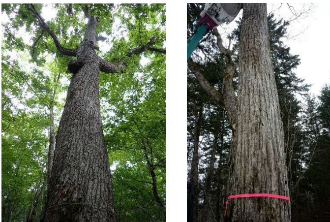
図2. 樹皮が右にねじれているミズナラ（写真左）と通直なミズナラ（写真右）。いずれも大きな個体（推定樹齢200年以上）で市場価値は高いが、右の個体は高品質とみなされるため価格は数倍になることがある。