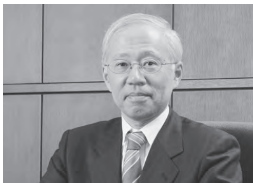
笠原正典総長職務代理（現総長代行）