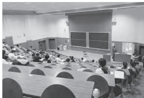
収容定員20%程度の配置での筆記試験の様子