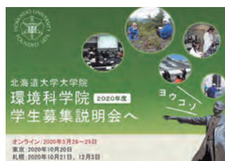
学生募集説明会全体説明時の資料