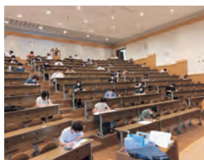
理学部におけるレベル2感染症拡大防止対応と筆記試験実施について