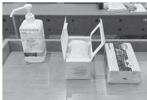
理学部大講堂で用意した感染拡大防止グッズ