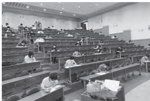
収容定員20%程度の配置での筆記試験の様子