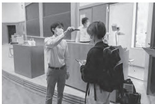
理学部大講堂で用意した感染拡大防止グッズ （非接触による検温）