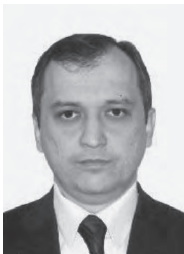
Gayrat FAZILOV 駐日ウズベキスタン共和国大使