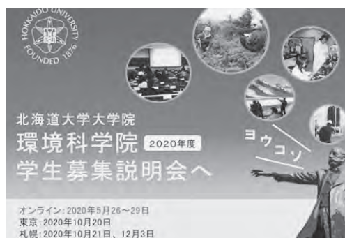
学生募集説明会全体説明時の資料