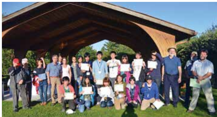
新渡戸カレッジ短期留学